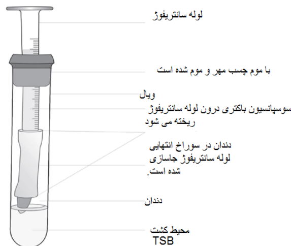
تصویر ۱- تصویر دستگاه استفاده شده در آزمایش

گروه ۳) مخلوط خامه ای کلسیم هیدروکسید (گلچای-ایران) با لیدوکائین (دارو پخش- ایران)