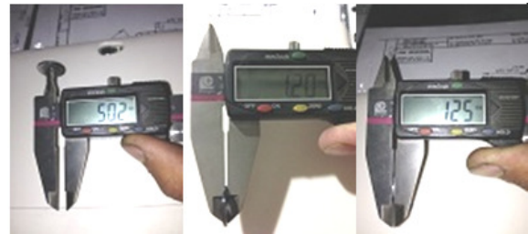
شکل ۱: ضخامت‌های مختلف جهت سمان کردن

پرسن قرار گرفت و اضافات آن توسط قلم مخصوص، کارو شد. برای جبران انقباض پرسن، هر یک از دیسک‌ها دو بار پرسن گذاری و عمل پخت انجام شد تا ضخامت ۱/۲ میلی‌متر ایجاد شود، سپس دیسک‌ها توسط Diagen turbo Grinder مسطح و ضخامت یکنواخت پیدا کردند. در نهایت کلیه دیسک‌ها گلیز و آماده سمان کردن شدند (شکل ۱، ۲).