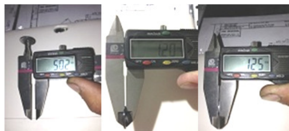
شکل ۱: ضخامت‌های مختلف جهت سمان کردن

پرسن قرار گرفت و اضافات آن توسط قلم مخصوص، کارو شد. برای جبران انقباض پرسن، هر یک از دیسک‌ها دو بار پرسن گذاری و عمل پخت انجام شد تا ضخامت ۱/۲ میلی‌متر ایجاد شود، سپس دیسک‌ها توسط Diagen turbo Grinder مسطح و ضخامت یکنواخت پیدا کردند. در نهایت کلیه دیسک‌ها گلیز و آماده سمان کردن شدند (شکل ۱، ۲).