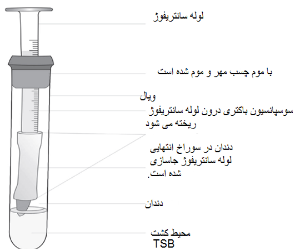
تصویر ۱- تصویر دستگاه استفاده شده در آزمایش

گروه ۳) مخلوط خامه ای کلسیم هیدروکسید (گلچای-ایران) با لیدوکائین (دارو پخش- ایران)